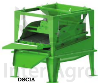
DCSIA Dvojsitová predčistička

Predčističky s plochými sitami "OSCIA" - sú vysoko výkonné stroje určené na predčistenie rôznych plodín od veľkých zvyškov a inklúzií.